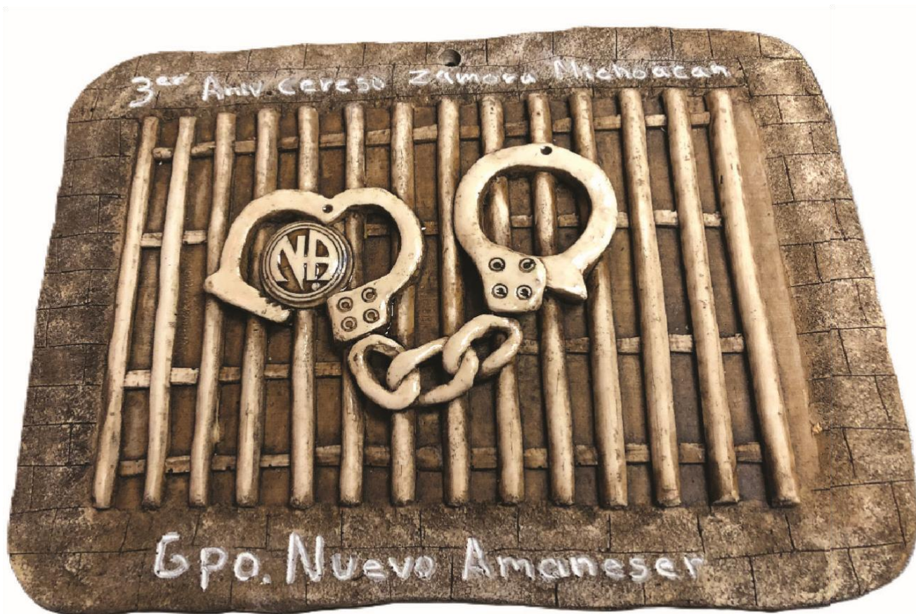
Творчество к 3-ей годовщине группы «Новый рассвет» в 2018 г., г. Самора-де-Идальго, штат Мичоакан, Мексика