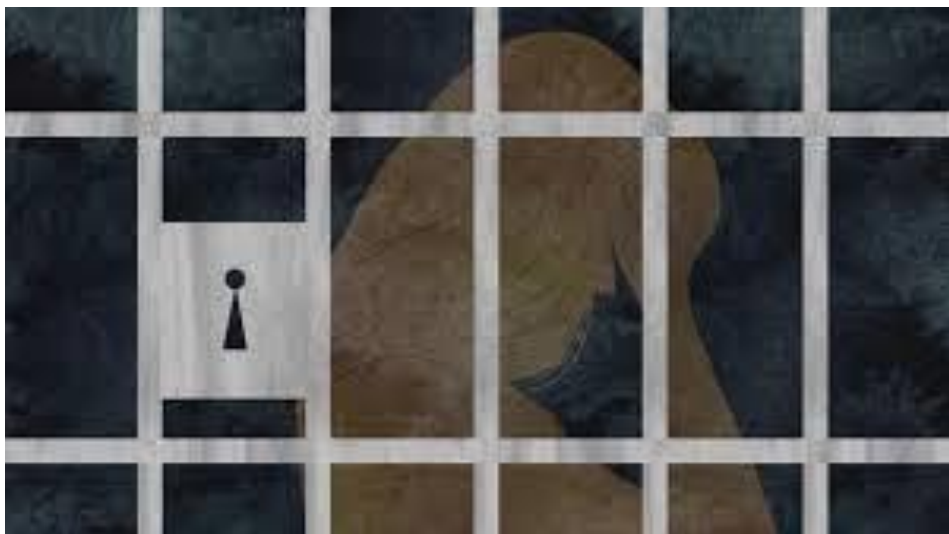
Творчество анонимного заключенного

Если хочешь увидеть свои работы, напечатанными в этом журнале, пожалуйста, пришли на электронную почту HandI@na.org свое творчество в виде файлов jpeg или pdf.