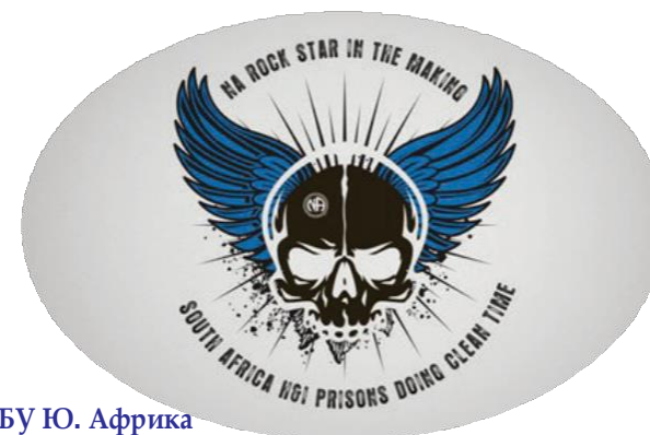
БУ Ю. Африка

*мощный вклад АН в чистое время заключённых в тюрьмах Южной Африки