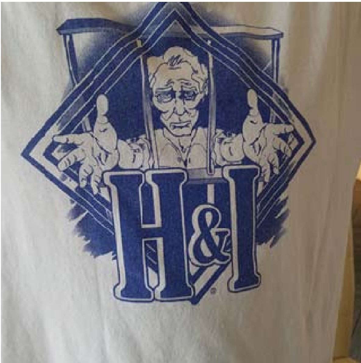
Camiseta de HeI, Reino Unido

Si te gustaría ver tu arte impreso aquí, por favor envía archivos JPEG o PDF a Handl@na.org o por correo a: Reaching Out, c/o Servicios Mundiales de NA, PO Box 9999, Van Nuys, CA 91409.