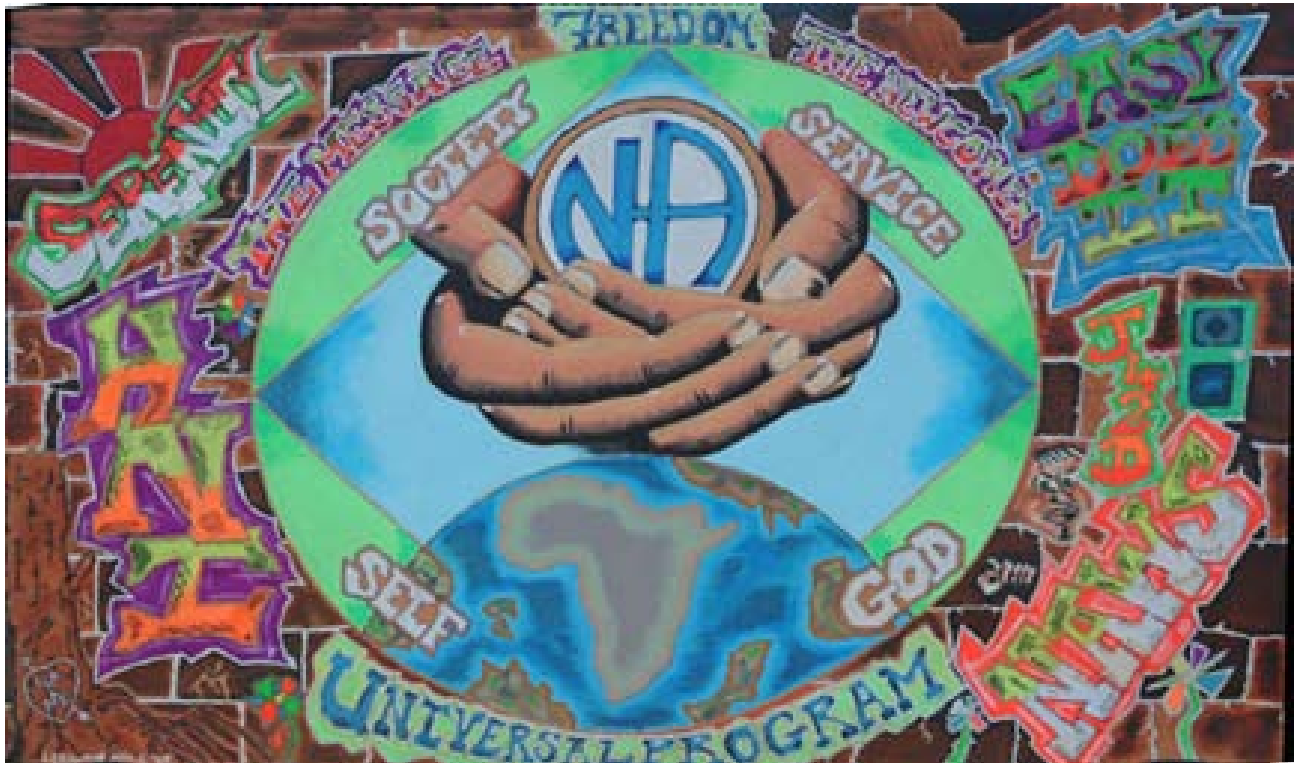
Pancarta de la prisión de Leeukop, Sudáfrica