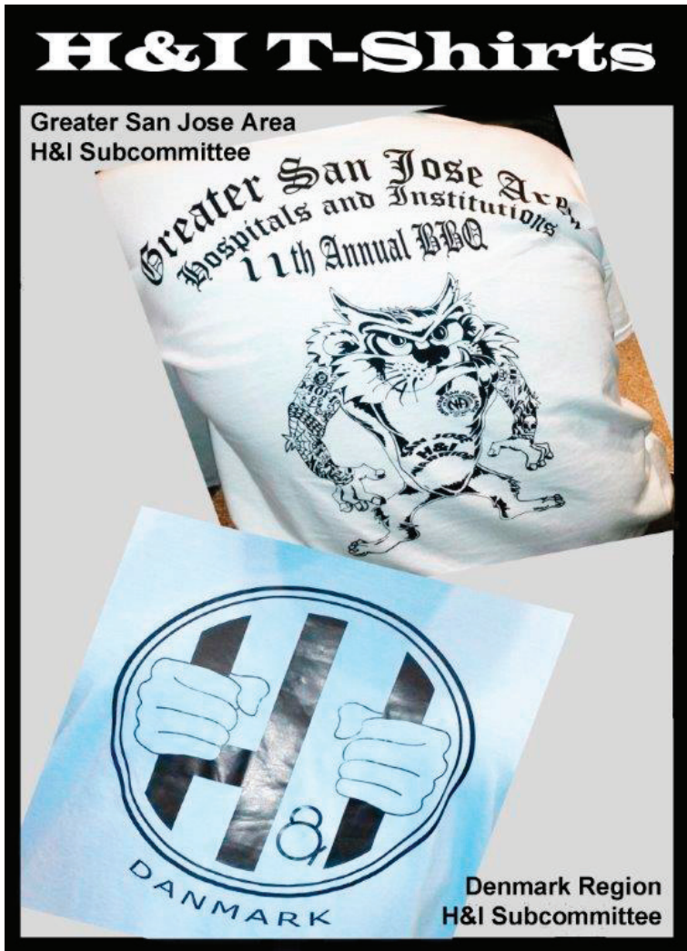
Camisetas de H&I Subcomitê de H&I da Área Grande San Jose Subcomitê de H&I da Região Dinamarca

Muitos membros, grupos e comunidades de NA fazem camisetas voltadas para H&I. Acreditamos que levar a mensagem de recuperação de NA é uma ação criativa e uma arte. Por favor, compartilhe fotos de sua camiseta de H&I conosco! Nós gostaríamos de apresentar a sua arte. Envie arquivos JPEG ou PDF para handi@na.org (Inglês) ou historiaspessoais.ro@gmail.com (Português)