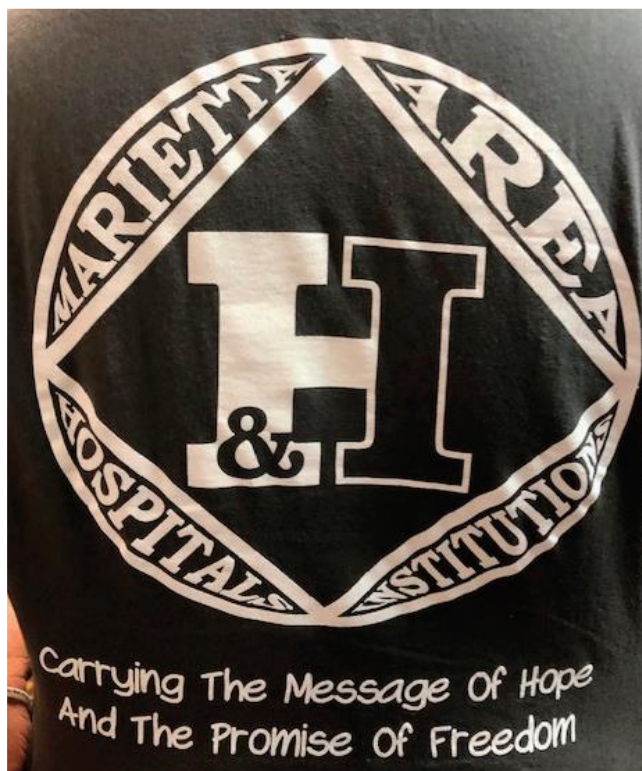
Футболка из округа Мариетта