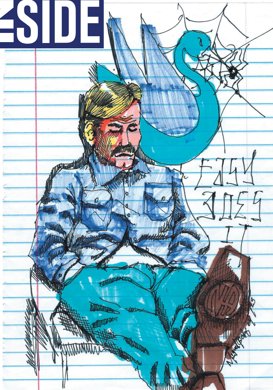
Membro no painel de NA