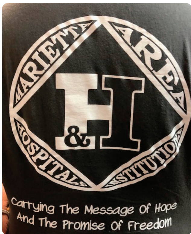
Camiseta Área Marietta