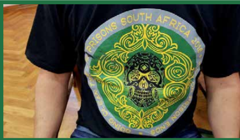
Camiseta de H&I da África do Sul

Fundos – Bairro Cambuí – CEP 13010-041 Campinas – SP (Português).