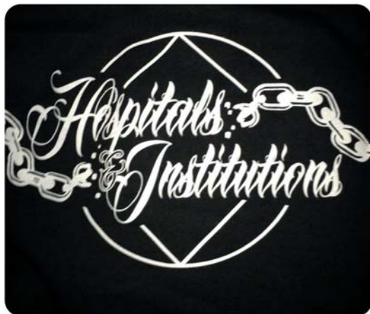
Camiseta de H&I da África do Sul