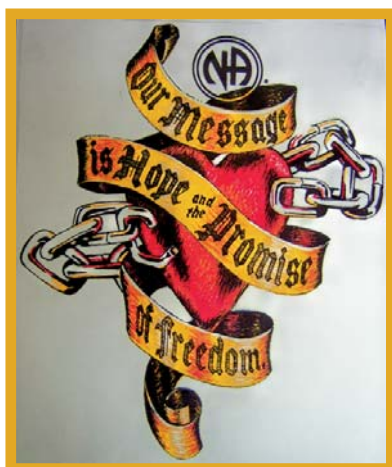
Inmate, California, USA