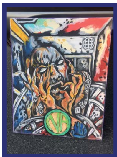
Inmate, California, USA