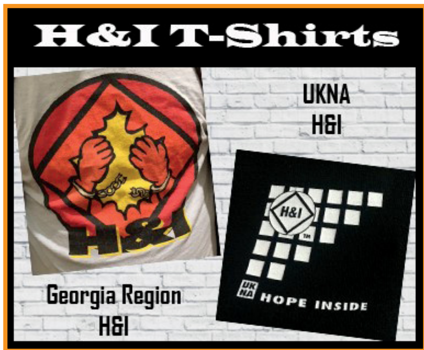
Camisetas de H&I Região Geórgia e Região Reino Unido.

NOTA: Somente as cartas, artes e/ou fotos enviadas aos cuidados do Reaching Out serão enviadas aos editores para publicação e, o envio destas para um dos endereços acima, implica a autorização do autor para sua publicação.