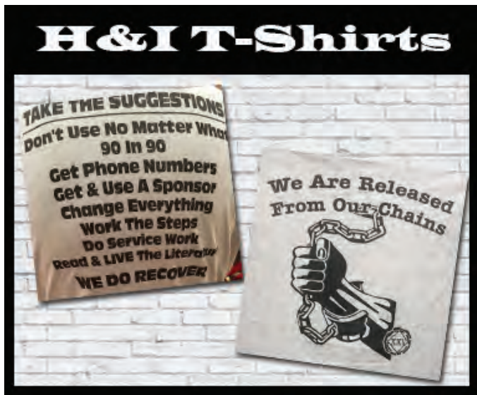
Camisetas de H&I

"Considere as sugestões: Não use, aconteça o que acontecer 90 dias 90 reuniões Pegue números de telefone Consiga um padrinho e use-o Mude tudo Trabalhe os passos Preste serviço Leia a literatura e VIVA-A NÓS REALMENTE NOS RECUPERAMOS"