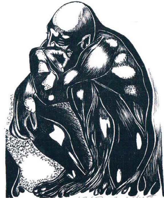
Figura “O velho eu está morto e enterrado”