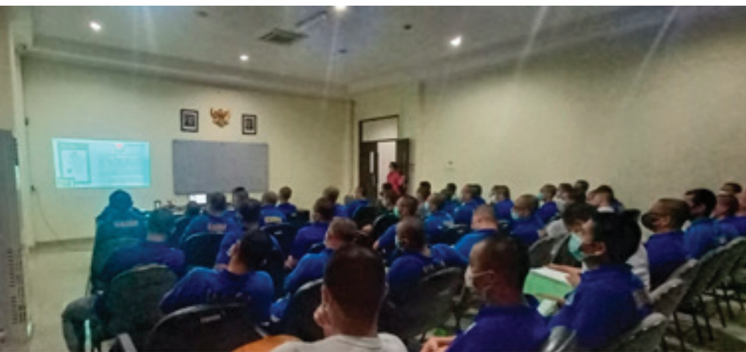
Reunião de H&I na Indonésia