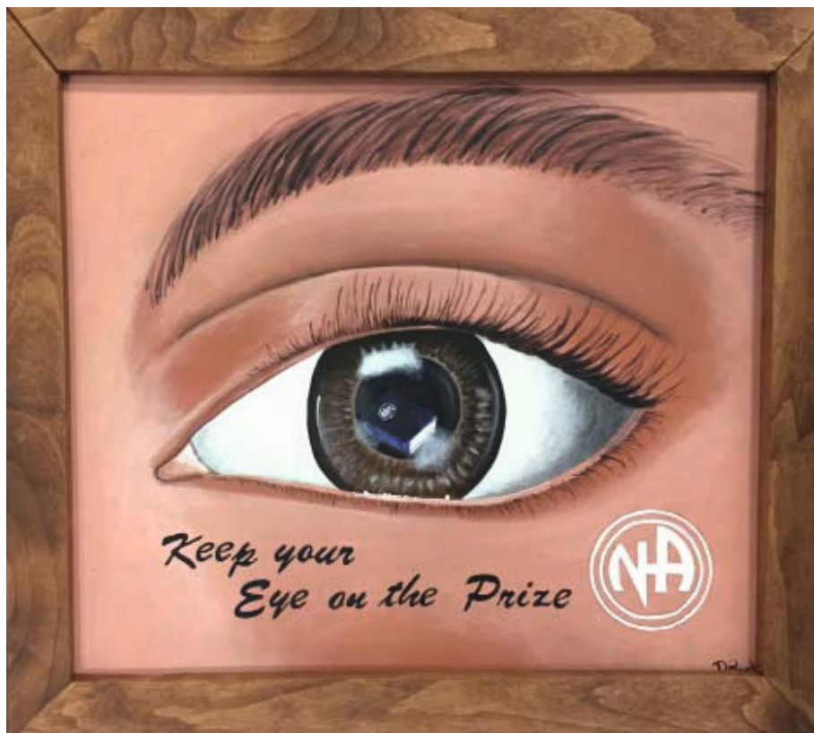
«Продолжай смотреть на приз» Заклученный, штат Калифорния, США