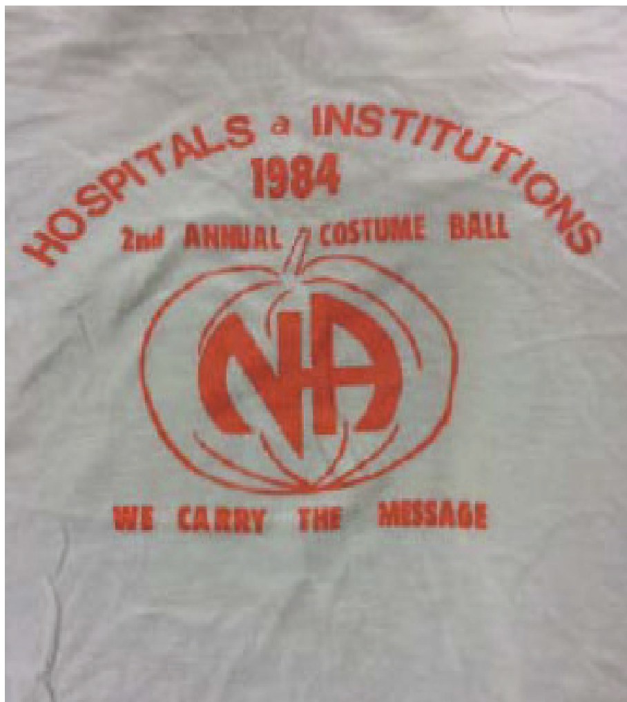
Футболка комитета по Больницам и Учреждениям Нью-Йорка на заре существования комитета