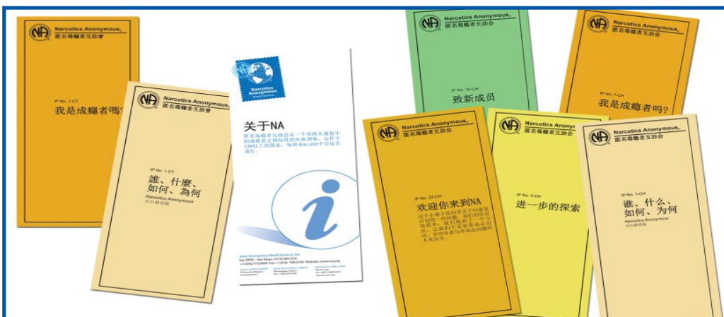
NYLIGEN PUBLICERADE PAMFLETTER PÅ BÅDE TRADITIONELL OCH FÖRENKLAD KINESISKA

samtal med NA när vi ständigt är där. NAWS fick belägg för detta vid National Association of Drug Court Professionals (USA). Många fler behandlingshem och domare stannade för att lära sig mer om NA och ställa frågor än vi upplevt vid tidigare konferenser, vilket fick oss att tro att fler beroende finner NA och tillfrisknar.