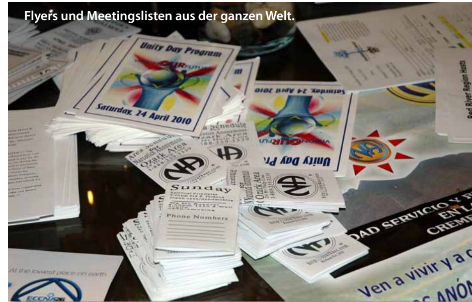
Flyer's und Meetingslisten aus der ganzen Welt.

Aktuelle Version des Membership Survey (NA Mitgliederumfrage), NA: A Resource in Your Community (Eine Hilfe in Ihrer Gemeinde) und Information about NA (Informationen über NA) sind verfügbar. Außerdem gibt es eine überarbeitete Version des Basic H&I Guide (Grundlagen des K&E Handbuchs), eine brandneue Ausgabe von PR Basics (Grundlagen der PR Arbeit) und andere PR-Werkzeuge. All diese Hilfen und andere Informationen über PR findet ihr unter www.na.org/?ID=PR-index .