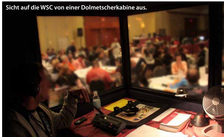
Sicht auf die WSC von einer Dolmetscherkabine aus.

Die vorgeschlagenen Änderungen an der Publikation In Times of Illness , wurde ebenfalls einstimmig angenommen, und die überarbeitete Broschüre ist ab Juli 2010 erhältlich. Money Matters: Self-Support in NA (IP #24) und Funding NA Services (IP #28) wurden ebenfalls angenommen und sind ab Juli 2010 erhältlich.