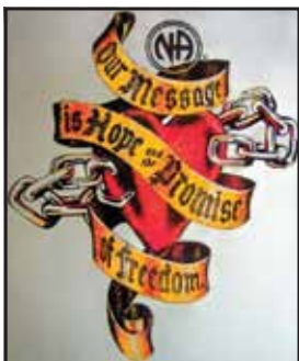
Logo from the Tri-Cities Area of NA, Washington State

Reaching Out is trying something new! NA communities design beautiful, recovery-oriented art for committees, conventions, and events. We believe that carrying the NA message of recovery is a creative act, and images provide a powerful message of the freedom we can find in NA.