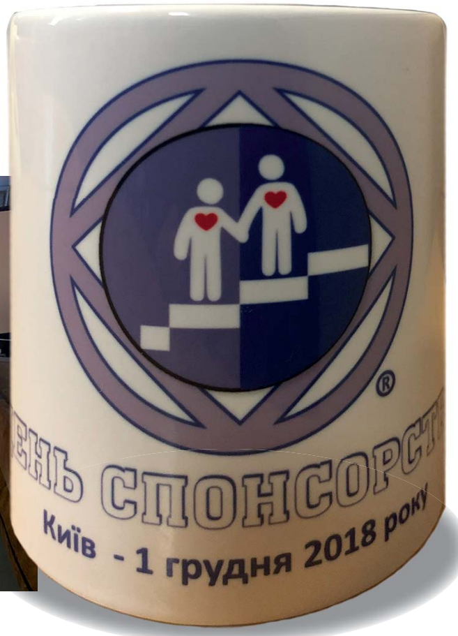
Première journée NA du parrainage, 1er décembre 2018, Kiev, Ukraine