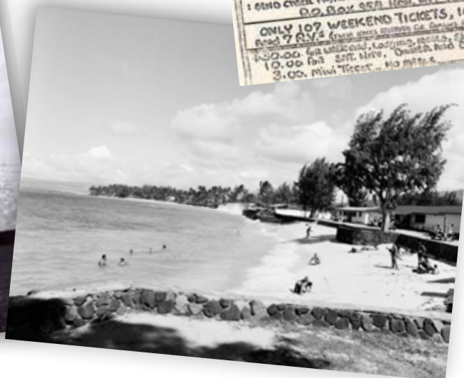
Фото: Erik R, Гавайи, США