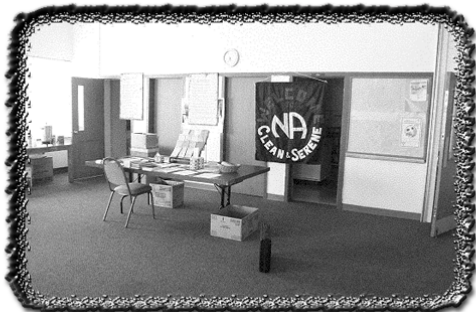
Limpios y serenos, Colorado

Quince años más tarde, han cambiado algunas caras. Algunas de las personas que estaban cuando llegué se han mudado, otras siguen investigando. Algunos han muerto, limpios o consumiendo. Sin embargo, la sensación es